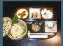
町家御膳 (右門一番街店)

●季節によりメニューの内容が変わる場合がございます。●予約の都合でご希望に添えない場合がございます。