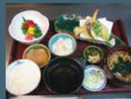
天麩羅付旬刺身定食 (小江戸蔵里)