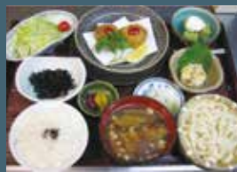
小江戸御膳(小江戸蔵里) 小江戸ばす限定メニュー