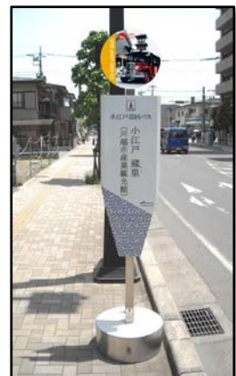
小江戸巡回バス・バス停