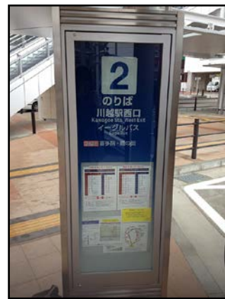
川越駅バス停 2 番のりば